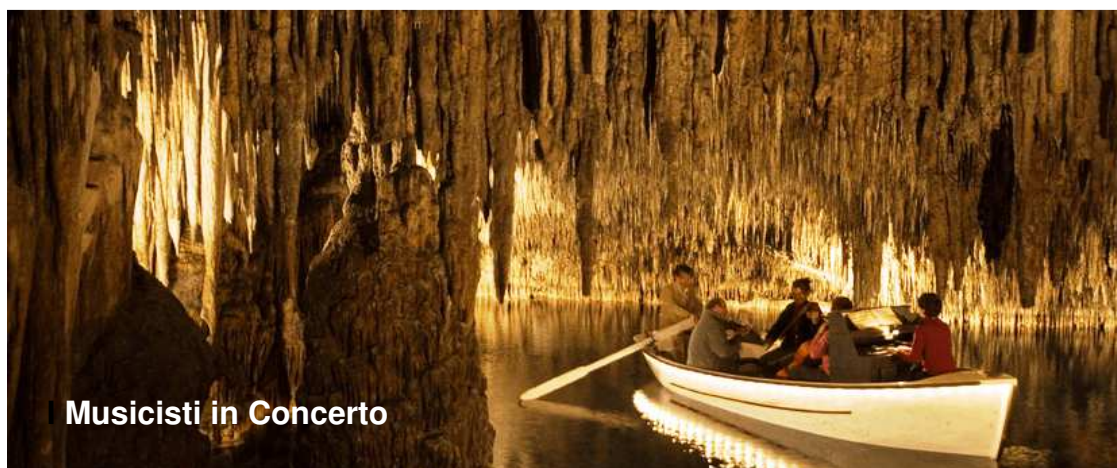
Musicisti in Concerto

Un’illuminazione studiata ed interpretazioni di musica classica accompagnano la traversata in barca del lago Martel, il lago sotterraneo piú grande del mondo. Costo entrata 15,00 €